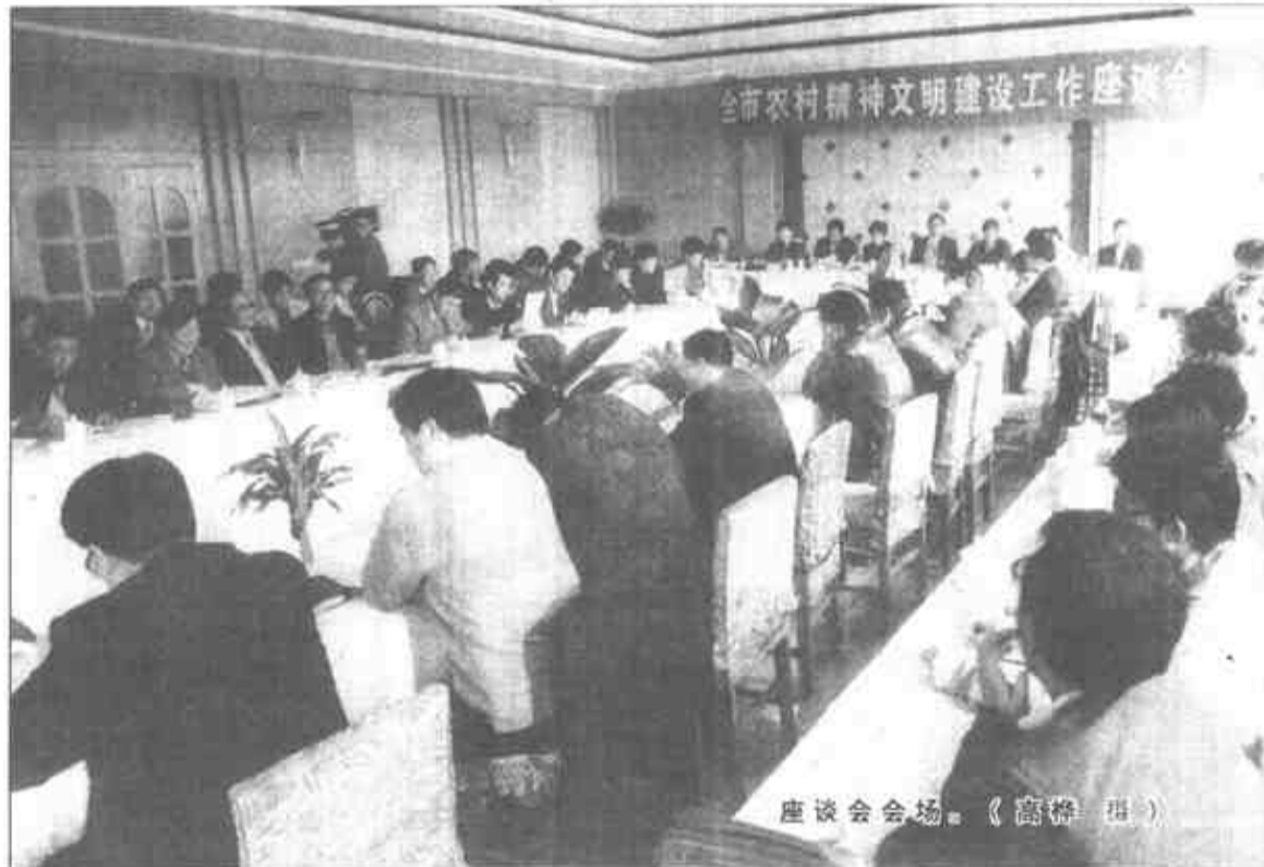
座谈会会场。

市人大常委会副主任蒋成全、副市长杨志良、市政协副主席关美华参加了会议。(记者 徐纯亮)